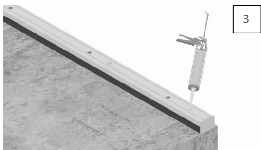
Vul het gat met de chemische componenten.