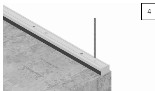
Plaats het draadeinde in de mortel en laat deze uitharden.