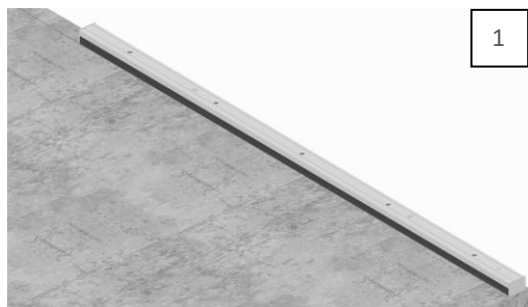
Plaats de ISP stelregel