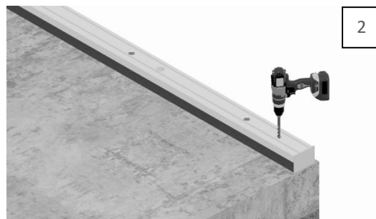
Boor de gaten voor het hold-down-anker. Reinig de gaten door deze 4 keer uit te blazen, 4 keer te borstelen en opnieuw 4 keer uit te blazen